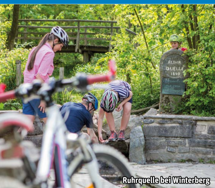
Ruhrquelle bei Winterberg