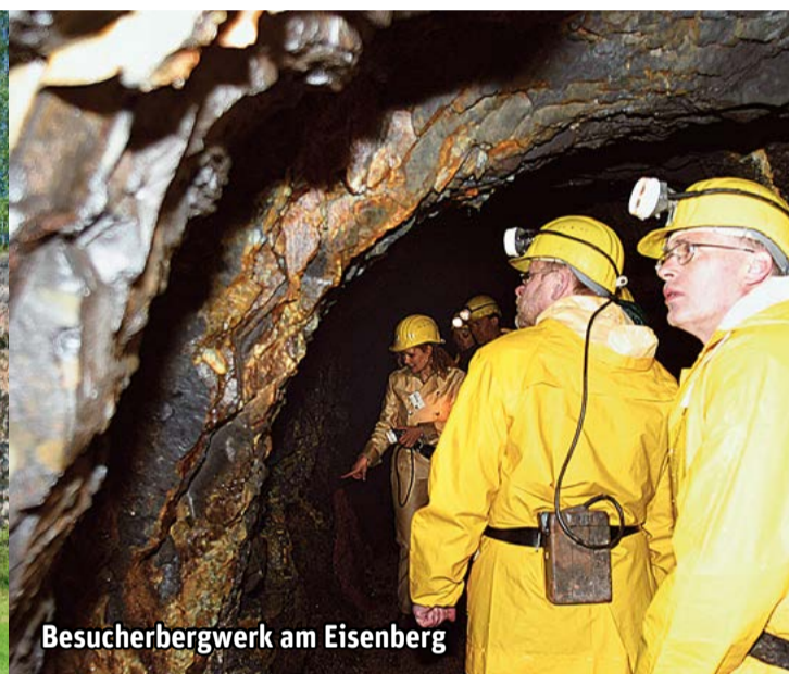
Besucherbergwerk am Eisenberg