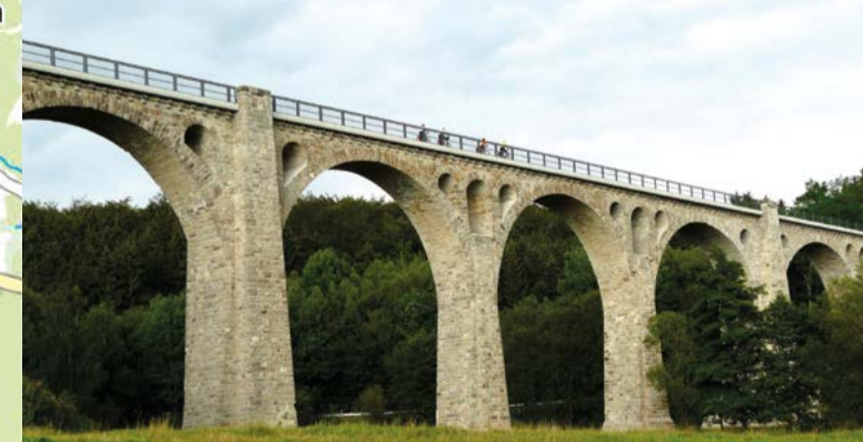
Selbacher Viadukt auf dem Ederseebahn-Radweg